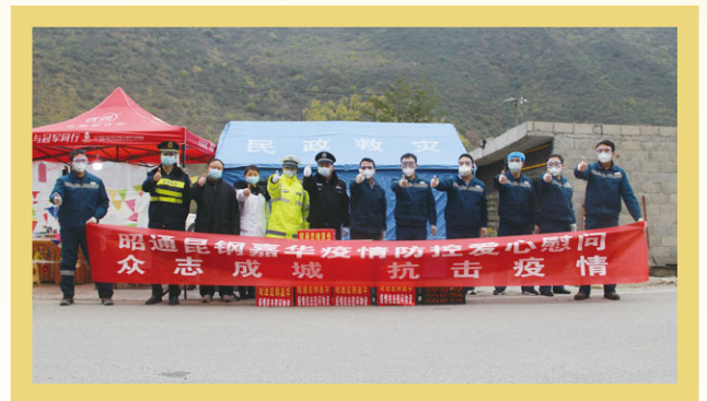
管理層於雲南省昭通市派發抗疫包。