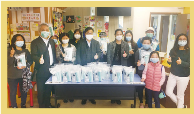
管理層於香港太和青少年綜合服務中心派發抗疫包。

因此，嘉華建材不但採納「在家工作」安排，更透過捐贈內含口罩和消毒搓手液的抗疫包，支援中港兩地社區對抗疫情。在香港，我們與基督教香港信義會及建造業議會攜手合作，於不同地區派發抗疫包，向有需要的人士伸出援手。在湖北省鄂州，嘉華建材同事加入當地義工隊（「藍天救援隊」和「社區志願者」），協助派發抗疫包。