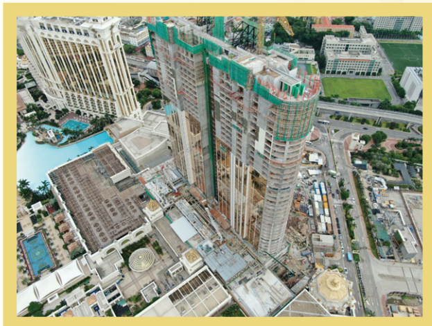
適合家庭旅客的高端酒店大樓

儘管要應對新冠肺炎的疫情，集團駐日本的團隊繼續為拓展日本市場而努力。我們視日本為長遠發展的理想機遇，能與我們在澳門的業務和其他海外發展計劃相輔相成。銀娛與摩納哥公國的「蒙地卡羅濱海渡假酒店集團」(Société Anonyme des Bains de Mer et du Cercle des Étrangers à Monaco)和我們的日本合作伙伴，均期待將我們的世界級綜合度假村品牌帶到日本。