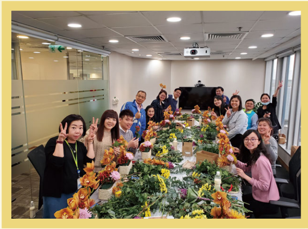
迎春接福花藝工作坊。

嘉華建材推動關愛文化，以確保同事身心健康。嘉華建材同樂會持續舉辦多項活動，例如迎春接福花藝工作坊、福鼠迎春手工裝飾工作坊、「嘉華步步賞」及端午節慶祝活動等，進一步加強「一嘉人」的精神。