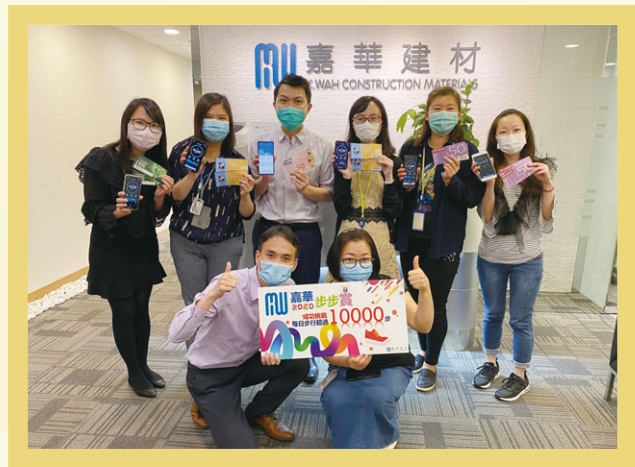
「嘉華步步賞」健康計劃宣傳「走多一點，健康多一點」的概念。

嘉華建材於本年度榮獲ISO 50001能源管理體系認證。我們認為，採用國際認可的能源管理體系可提升旗下業務的能源效益，減少損耗電力資源，從而幫助減緩氣候變化。